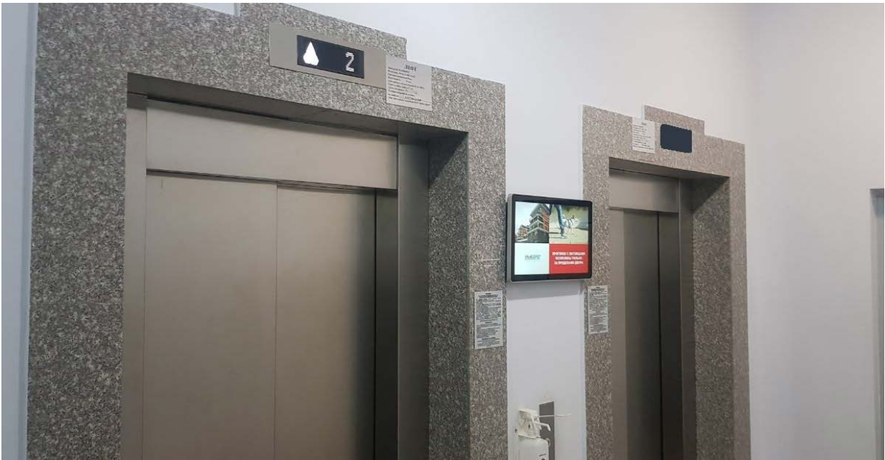
ЖК « Atlantis Deluxe».